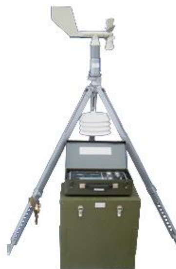
Рисунок 2 Полевой вариант М-49М

Пломбирование станций метеорологических М-49М не предусмотрено.